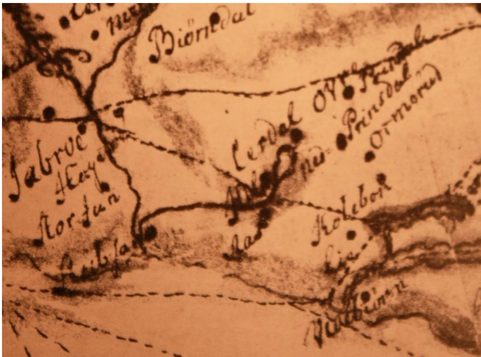
Kart fra 1716 (fra det lokalhistoriske heftet Bjørn Bonde 1-1978).

På to gamle kart fra 1700-tallet er Lusetjern tydelig inntegnet i en sidebekk til Ljanselva.