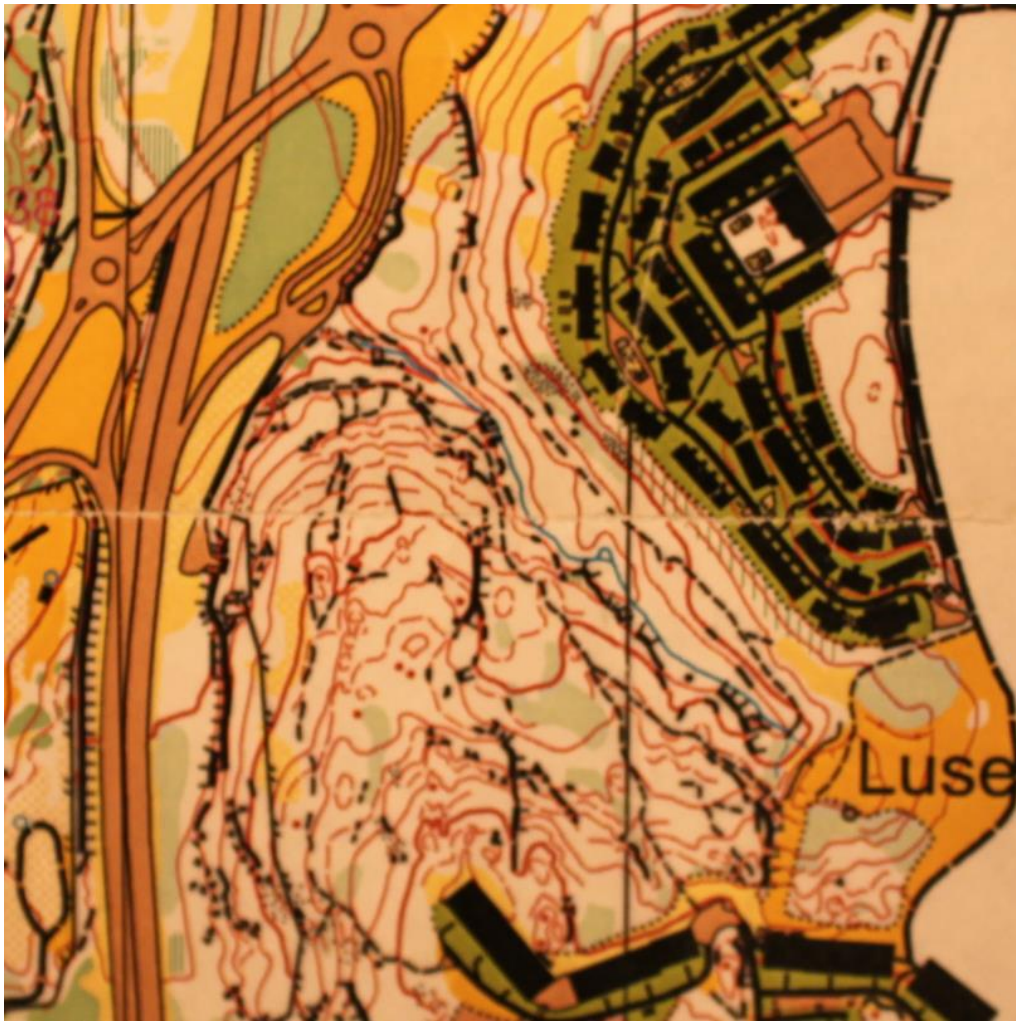
Utsnitt av orienteringskart fra 2001 (Bækkelagets Sportklub).