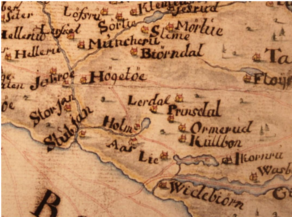
Kart fra 1757 (fra Utsikt over Nordstrands historie, 2000).

Også på et kart fra år 1800 kan vi se et tjern der de to bekkene Rosenholmbekken og Holmbekken møtes.