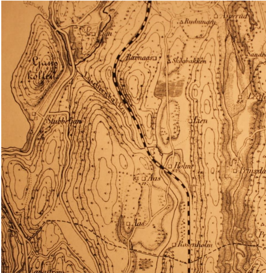
Kart fra 1885 (Kristiania og omegn, blad II, 1885).

På et kart fra 1885 ser vi at det ikke er mye igjen av Lusetjern, men vi ser Smålensbanens første trasé.