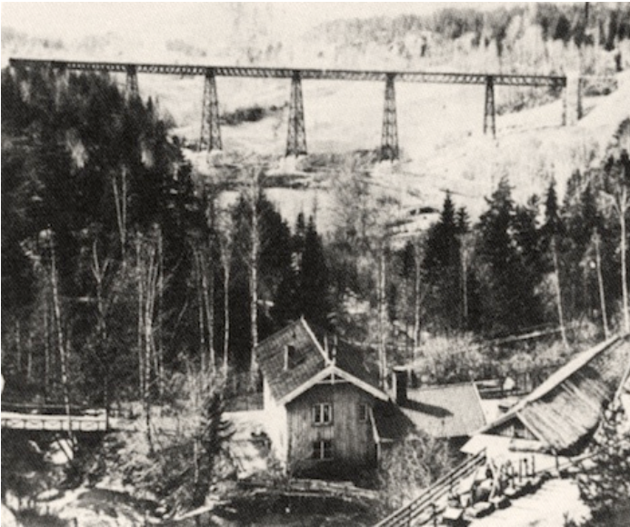
Bestyrerboligen ved kruttverket som senere ble til husflidskolen, fotografert i begynnelsen av 1880-årene. Ljabruveien i forgrunnen og Ljansviadukten i bakgrunnen

Skolen ble startet med midler (kr. 35.000) som ble gitt som erstatning fordi kruttverket ikke kunne bygges opp igjen. Verket ville blitt liggende alt for nær vei og jernbane.